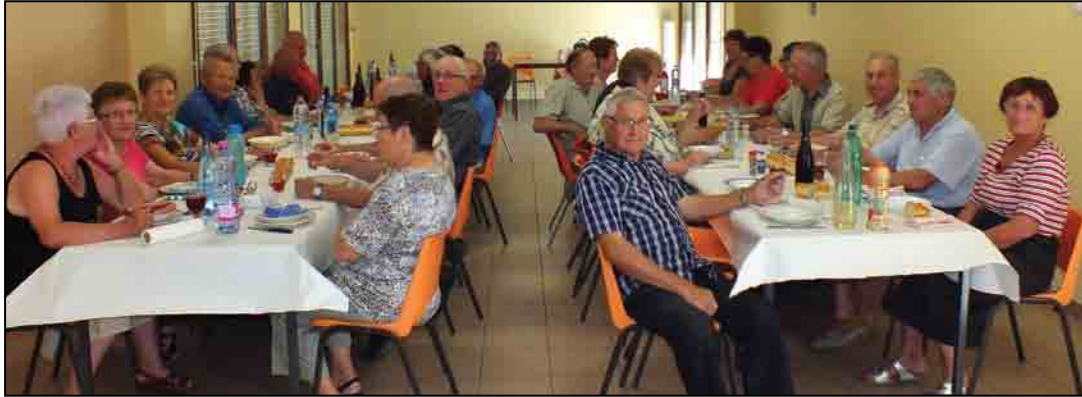
Apéro maison, soupine, méchoui, belote puis soupe à l'oignon le soir ont marqué cette journée ensoleillée.